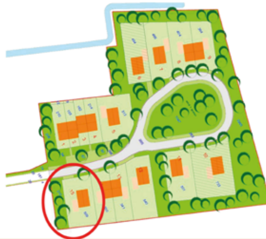
Mogelijke starterswoningen op 't HaartseBos

Vanaf 28 jaar wordt een contract voor 2 jaar aangeboden. Voordat deze woningen worden gerealiseerd dienen wel eerst "namen en rugnummers" bekend te zijn. Mocht je geïnteresseerd zijn of vragen hebben neem dan contact op met Haarts Belang via; haartsbelang@haart-info.nl of app naar 06 42006641