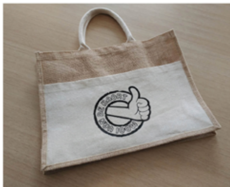
De tas van de Haart voor de nieuwe inwoners van onze buurtschap.

In deze tas kunnen ook kennismakingsproducten en/of (kortings)bonnen van bedrijven van de Haart worden gedaan. Het initiatief van deze tas is in samenwerking met Ons Genoegen. Heeft u zelf een idee over wat er nog in de tas kan worden bijgevoegd, of heeft u een naam/adres van nieuwkomers die voor deze tas in aanmerking komen geeft dit dan door via hj.langeler@kpnmail.nl of 0622296651